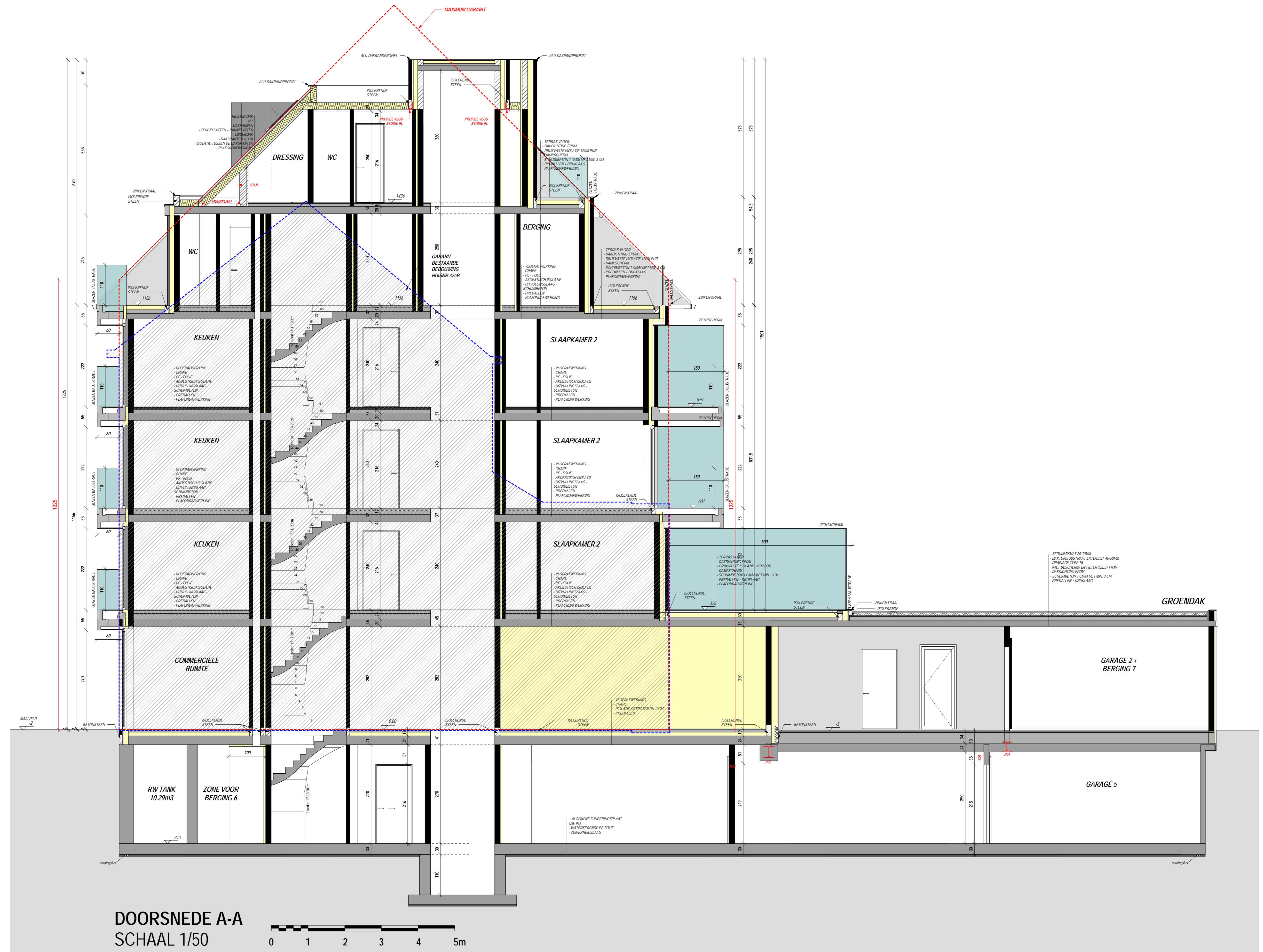
DOORSNEDEN A-A SCHAAL 1/50